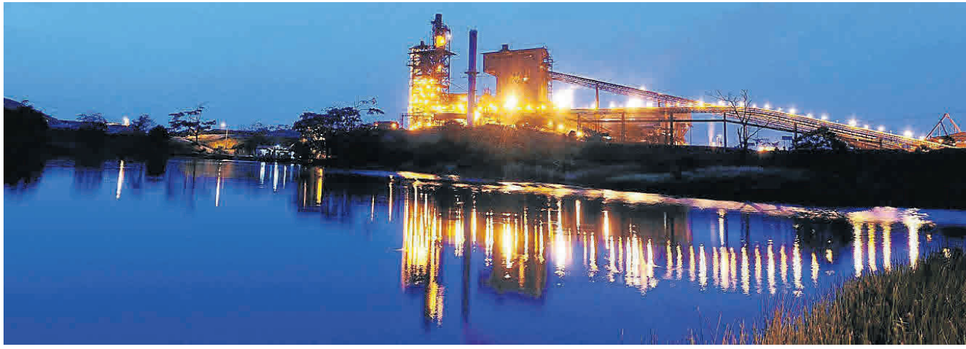
Instalaciones de Cerro Matoso, en Montelíbano (Córdoba).