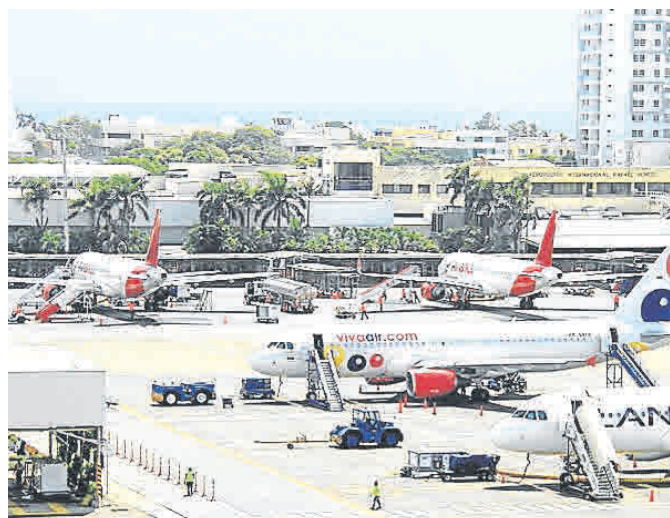
Plataforma del aeropuerto Rafael Núñez.

‘‘El evento de Cartagena nos debe abrir los ojos de cómo nos unimos para poner a Colombia en el mapa mundial de una industria significativa. El mercado interno es el objetivo’’, puntualizó Galofre.