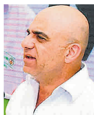
Francisco Mejía S. // COLPRENSA

"Esta iniciativa constituye una estrategia comercial con la que esperamos fortalecer nuestra presencia territorial y llegar cada vez a más colom-