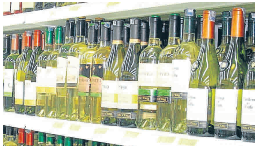
El grupo de las bebidas alcohólicas y tabaco, en Cartagena, acumula una variación de precios del 3,53% a abril de este año.

Alimentos, salud y bebidas alcohólicas, grupos de mayor variación de precios en abril en Cartagena. La sequía ha afectado la oferta de algunos productos y dispara sus precios.