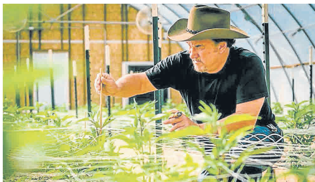
Cultivo de cannabis. Colombia con un enorme potencial.

Del lado nacional se espera la presencia del senador de la República de Colombia Juan Manuel Galán quien es autor de la Ley de Cannabis Medicinal y promotor de la reforma a la política de drogas en el país. Galán propondrá en Cartagena pasar del prohibicionismo y la criminalización del consumo, a una política de salud públi-