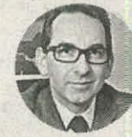
Andrés Valencia Ministro de Agricultura

"Si hay mucho interés al desarrollo de la industria y la producción de ella, pero será más cuando sea legal porque ahora hay bastante miedo al lavado de dinero".