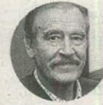
Vicente Fox Miembro de la Junta Directiva de Khiron

En el país uno de los términos que más se usan es el de "cannabis medicinal", sin embargo, el hecho de que las licencias hayan dado pie para la explotación de derivados, generó que las empresas vayan más allá. Uno de los primeros casos fue Khiron que el año pasado presentó una línea de maquillaje de lujo, la cual complementan con productos faciales. Recientemente, se conoció también que la Superintendencia de Industria y Comercio aprobó el registro de la marca Cannabeer , la cual es una cerveza a base de cannabis; pero el Invima informó que no tienen el registro sanitario para comercializar el producto. Actualmente sigue la discusión en esa bebida.